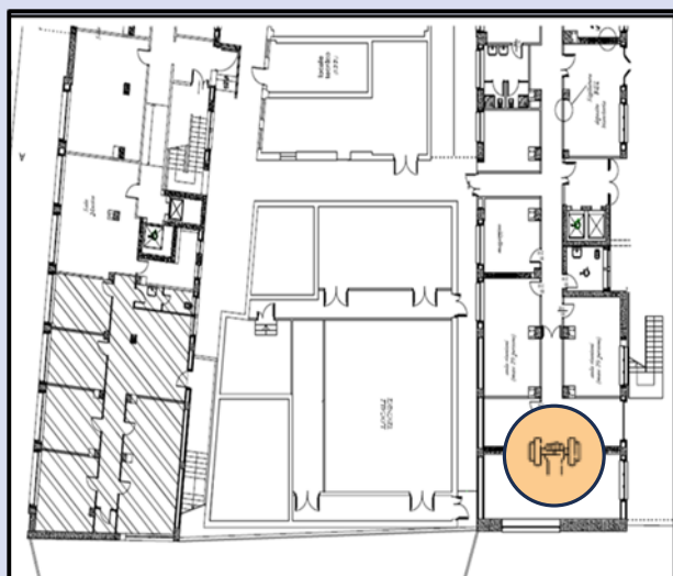
pianta piano interrato - lato sud