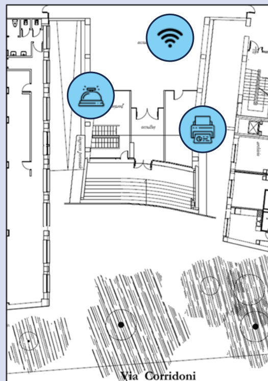
pianta ingresso - piano rialzato

Vicino alla reception si trova il locale stampa, ivi sono disponibili due stampanti multifunzione; il servizio è gratuito, l'utente deve utilizzare carta formati A4 e A3 personale.